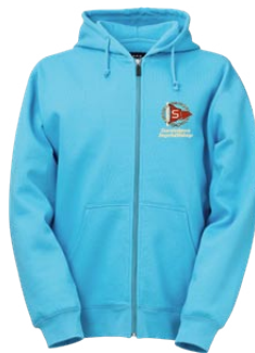
Huva Aqua ZIP 275 kr Strl. cl – vuxna