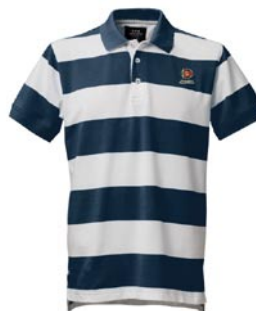
Piké 190 kr Strl. xs – xxl