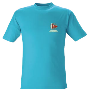
T-Shirt Aqua 95 kr Strl. cl – vuxna

Prova storlekar och beställa kläder gör man på kansliet