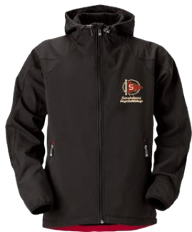
Jacka Soft shell 425 kr Storl. cl – vuxen