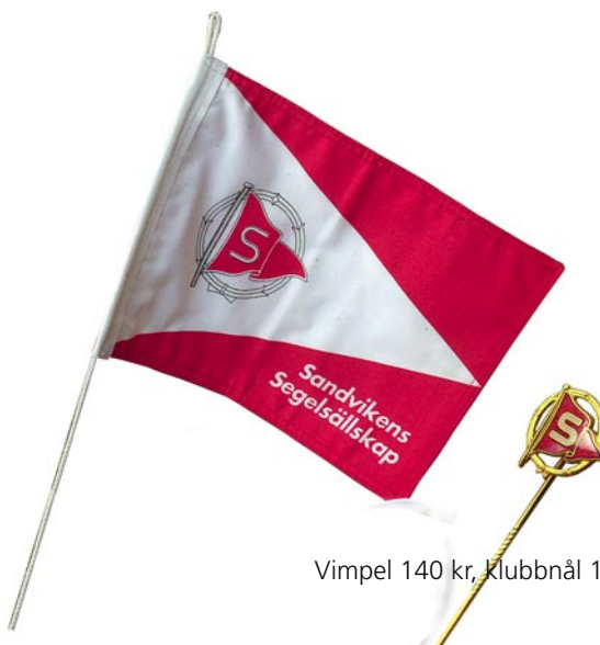
Vimpel 140 kr, Klubb nål 100 kr finns på Kansliet.

Med vänliga hälsningar Styrelsen Motorbåtsektionen